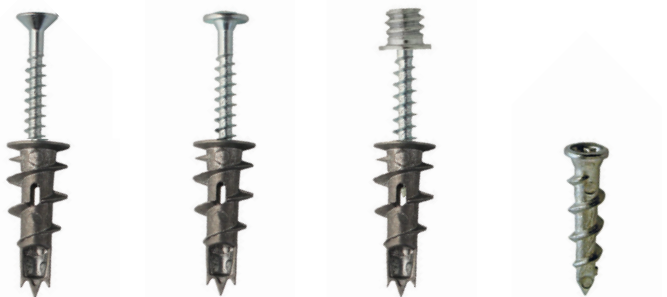
VIS TÊTE FRAISÉE KRONO-SF