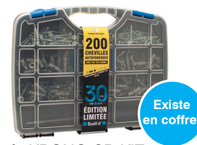
ref : KRONO-SR-KIT